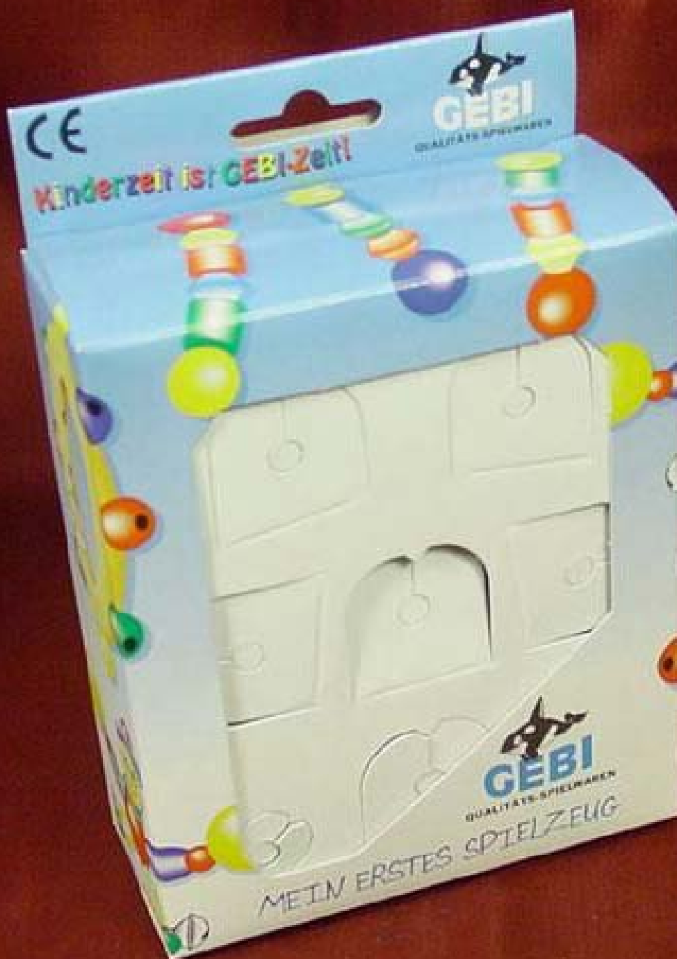
A) Papírová krabička, papírová vložka. Material: skladačková lepenka, tisk ofsetem