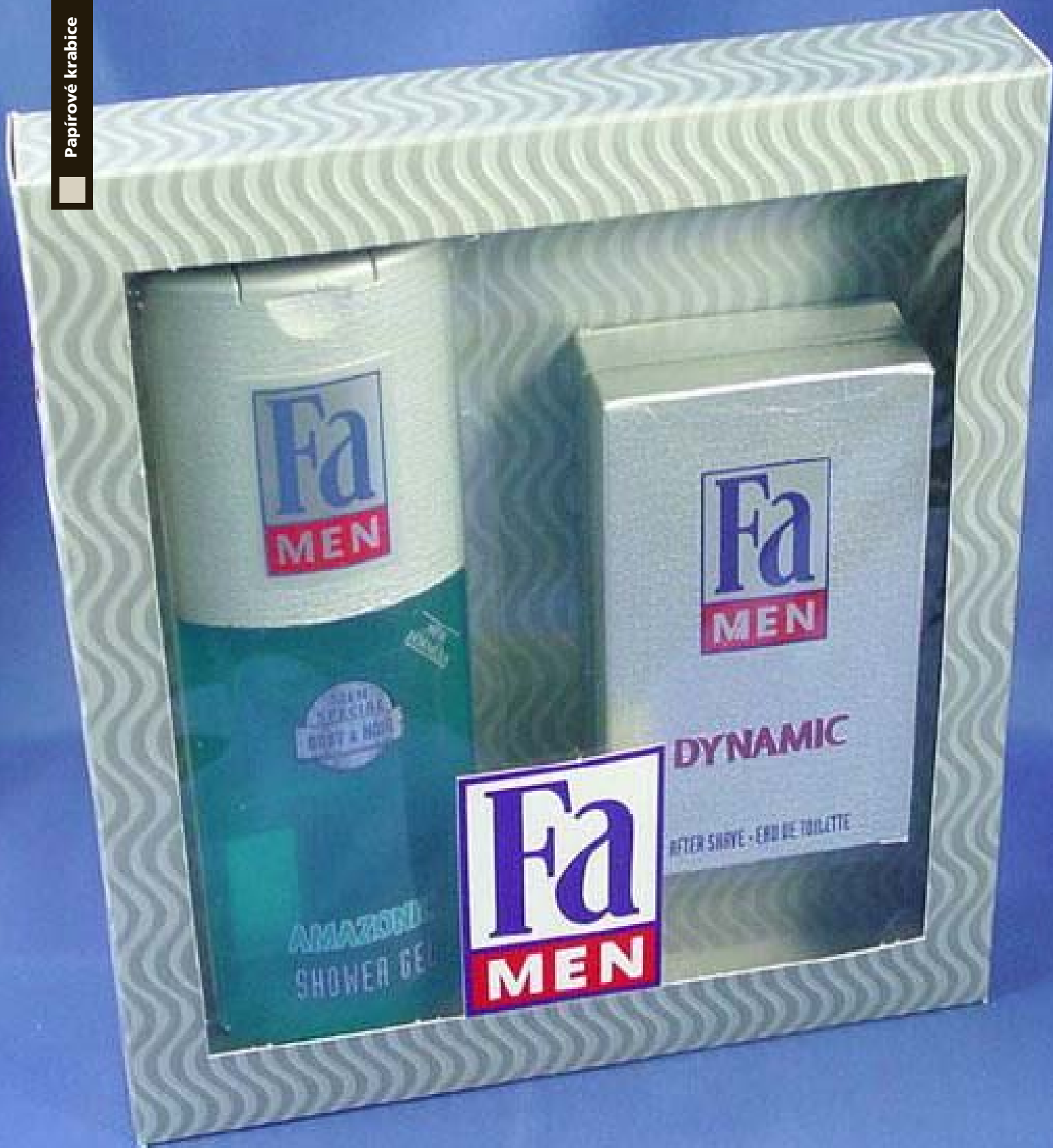
A) Papírová krabička, durofolová vložka. Materiál: skládačková lepenka, tisk ofsetem, sleporažba stříbrné vlnky.