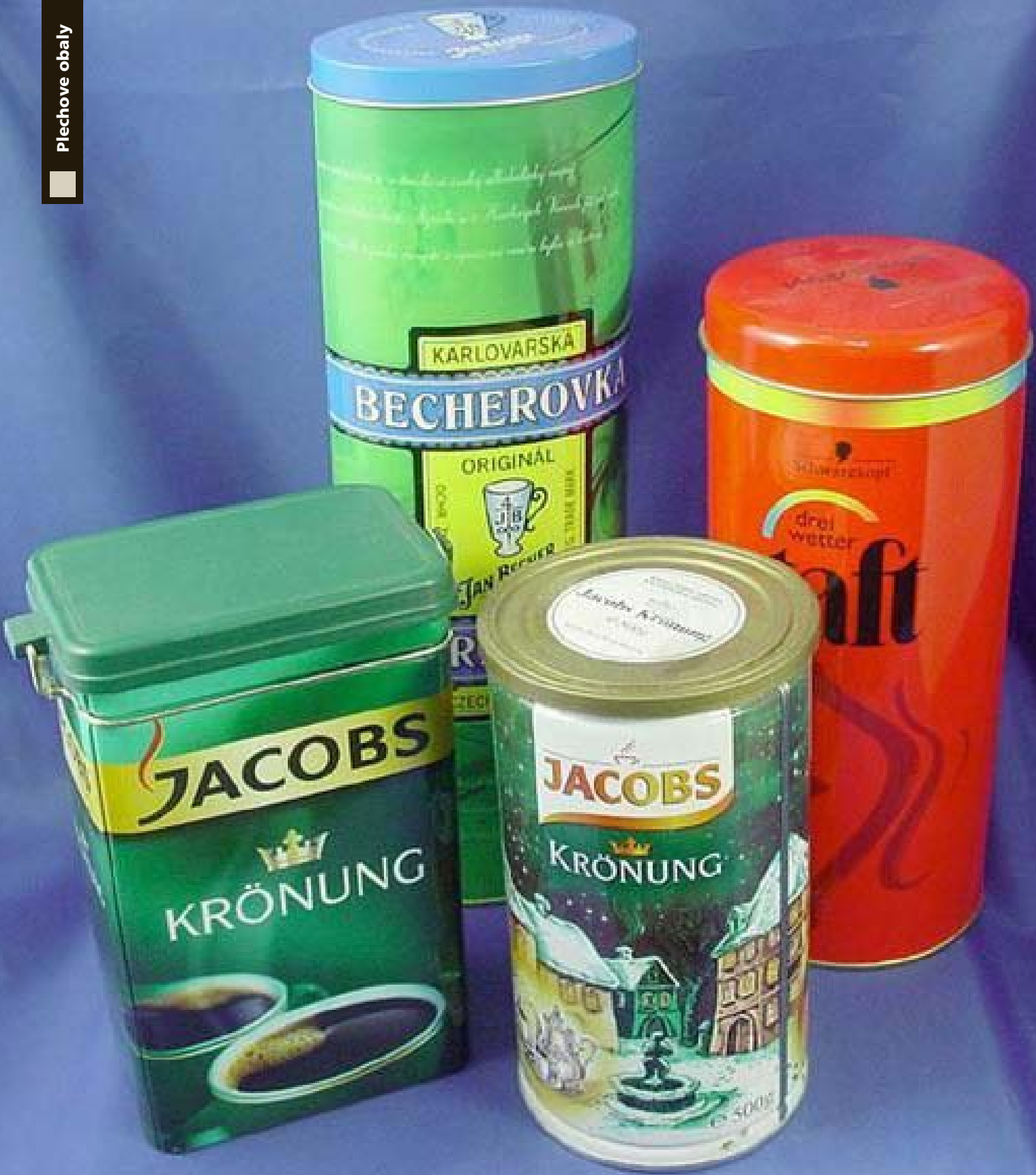
A) Reklamní potisk, výroba na zakázku