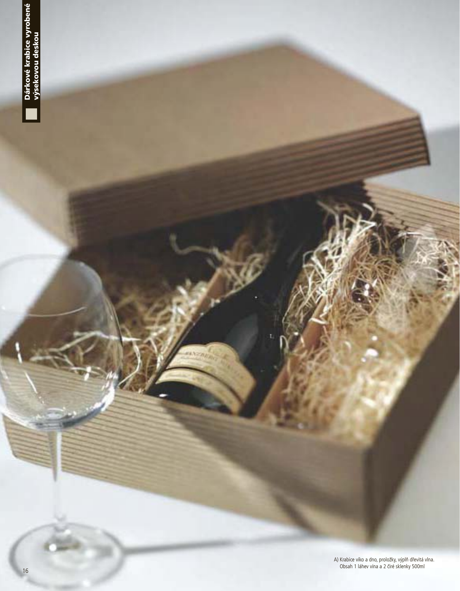
A) Krabice víko a dno, proložky, výplň dřevitá vlna. Obsah 1 láhev vína a 2 číré sklenky 500ml