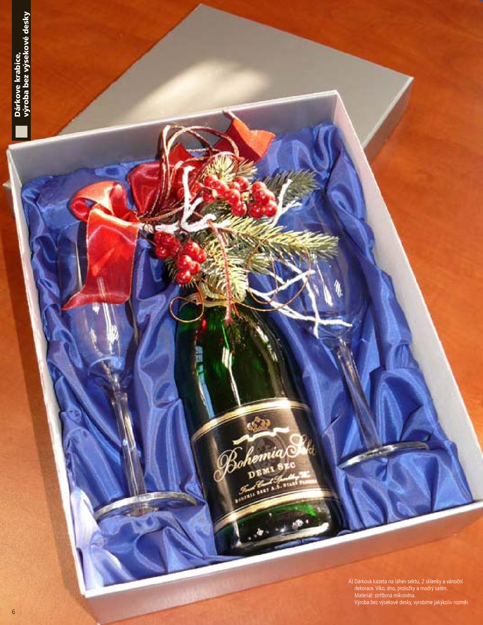
A) Dárková kazeta na láhev sektu, 2 sklenky a vánoční dekorace. Víko, dno, proložky a modrý satén. Materiál: stříbrná mikrovlna. Výroba bez výsekové desky, vyrobíme jakýkoliv rozměr.