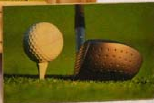
◀ ▶ B) C) Fotopotisk na dřevo