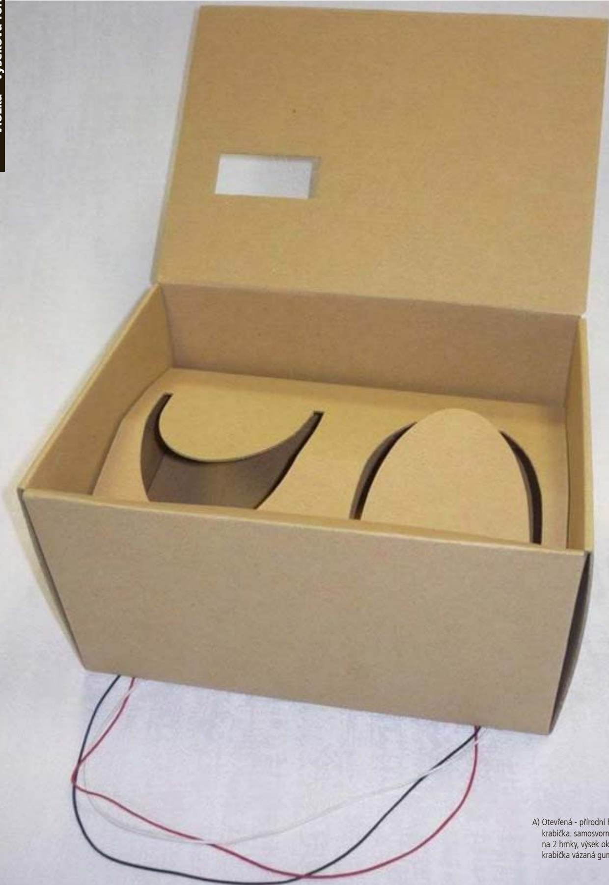
A) Otevřená - přírodní hnědá dárková krabíčka, samosvorná, vložky na 2 hrnky, výsek okénko na logo, krabíčka vázaná gumičkami.