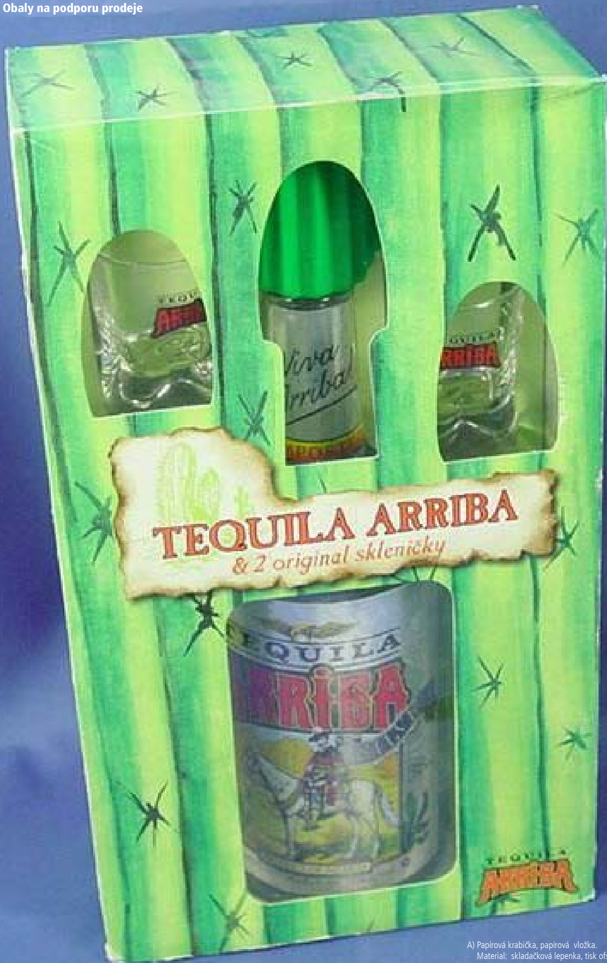
A) Papírová krabička, papírová vložka. Material: skladačková lepenka, tisk ofsetem, láhev a 2 sklenky