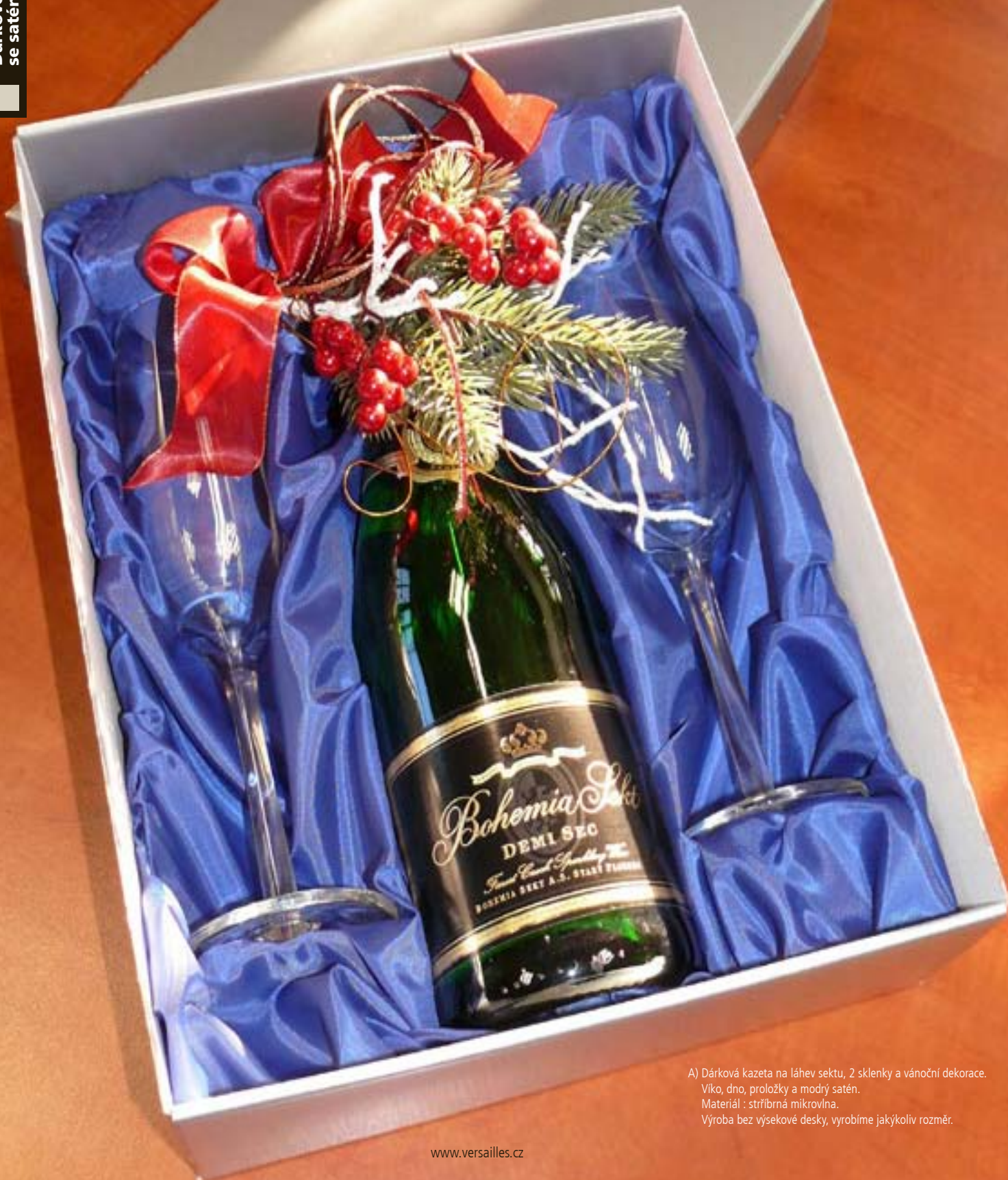
A) Dárková kazeta na láhev sektu, 2 sklenky a vánoční dekorace. Víko, dno, proložky a modrý satén. Materiál : stříbrná mikrovlna. Výroba bez výsekové desky, vyrobíme jakýkoliv rozměr.