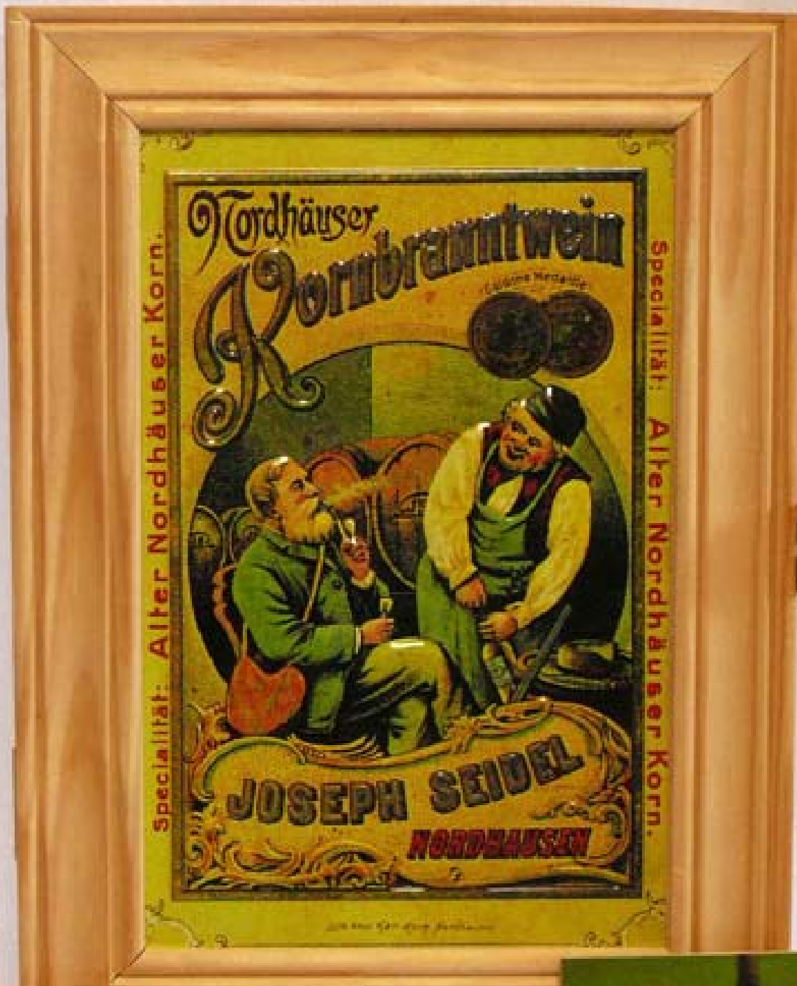
A) Dřevěná krabička se zámečkem a fotopotisk